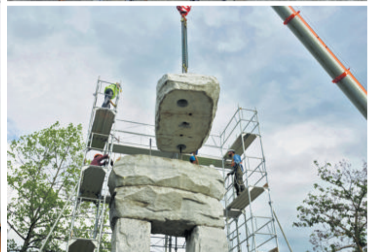
L'exposition présente le processus de réalisation des six œuvres d'art & tram, dont «Monochrome rose» de Pipilotti Rist (en haut) et «Le Sage» d'Ugo Rondinone (en bas).